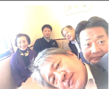
「指名委員会」 11 月 17 日例会終了後